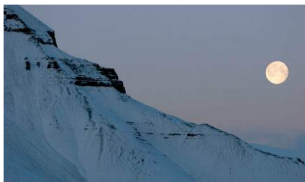
Månefint. Nesten alle i byen kan se Hiorthfjellet på andre siden av Adventfjorden. Og utsikten er ekstra vakker fra Varden. Her med måne.

Men hver gang jeg kommer tilbake, og det er nokså ofte, må jeg likevel opp til min gode venn, Varden. Hviske noen hemmeligheter. Lukke øynene. Legge kinnet mot de kalde steinene.